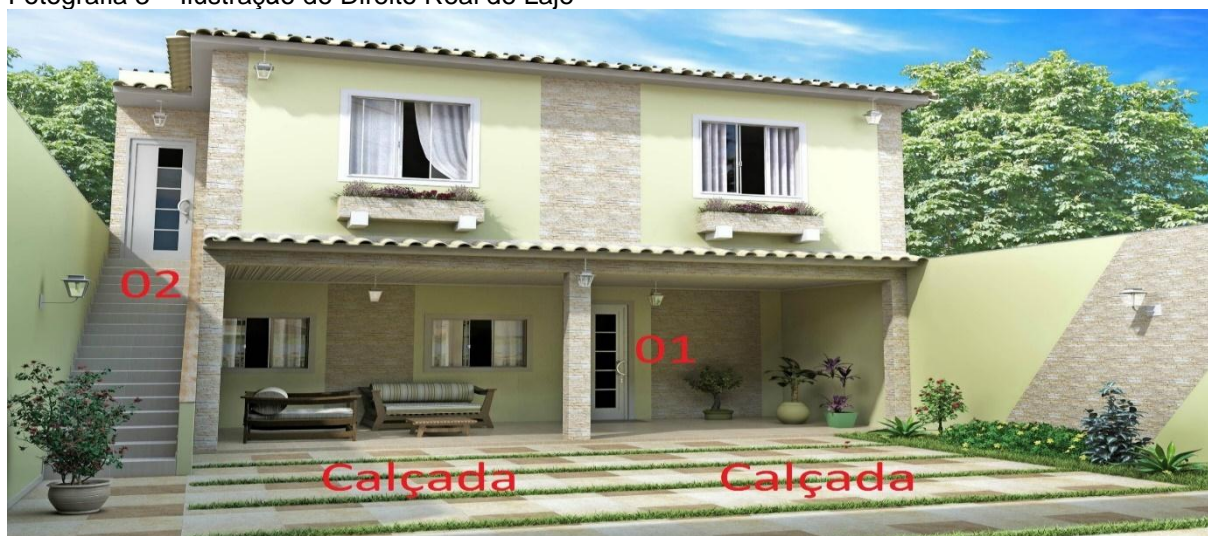
Fotografia 3 – Ilustração do Direito Real de Laje

Autor: desconhecido.