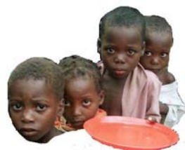
Direito à alimentação 228

Inicialmente, o direito à alimentação era considerado decorrência de outros direitos mais abrangentes, como o direito à vida.