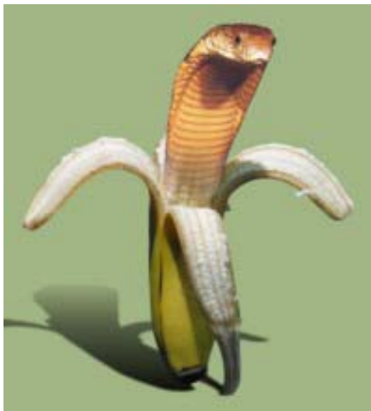
Banana transgênica 263

As organizações internacionais devem, sim, promover o uso da ciência e da tecnologia em favor da Humanidade. Mas, não podem, jamais, colocara o lucro como motor das novas descobertas.