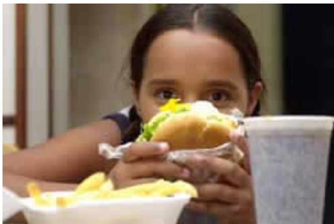
Fast food: alimentação moderna e inadequada 178

Também atua de forma decisiva a perda dos espaços públicos promovida pelo crescimento vertiginoso da violência, notadamente nos meios urbanos, e pela expansão imobiliária, com a ocupação intensiva do solo urbano.