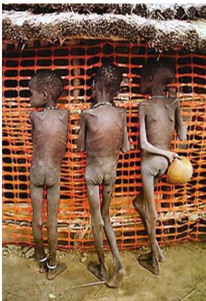
Crianças subnutridas em campo de refugiados 104

economicamente desenvolvidos do Norte”. A maioria dos famintos encontra-se na Ásia: “515 milhões – ou 24 por cento do total da população do continente”. 103