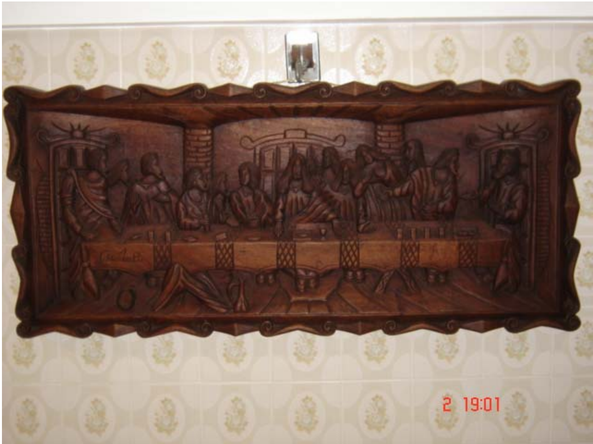
A Santa Ceia 166

Comer em família é ato estimado por muitos, ainda hoje. Torna-se verdadeiro ritual, com hora marcada e práticas concertadas consensualmente.