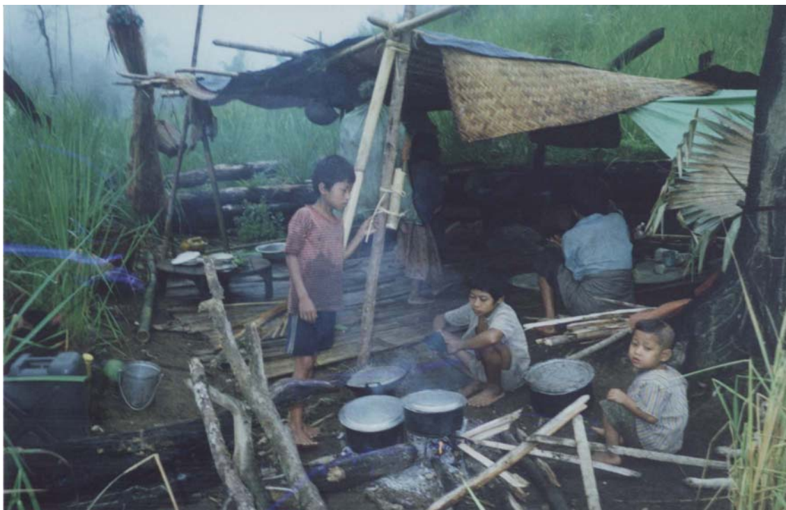
Acampamento na Ásia 99

FELIPE FERNÁNDEZ-ARMESTO noticia que as três últimas décadas do Século XIX conheceram a pior fome da Idade Contemporânea. Na Índia, por exemplo, feneceram de cinco a sete milhões de seres humanos. 100