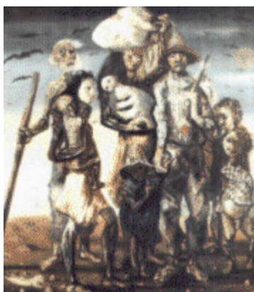
Os Retirantes (Cândido Portinari) 88

São as sombrias caravanas de espectros caminhando centenas de léguas em busca das serras e dos brejos, das terras da promessa. Com os seus alforjes quase vazios, contendo quando muito um punhado de farinha, um pedaço de rapadura [...], o sertanejo dispara através da vastidão dos tabuleiros e chapadões descampados, disposto a todos os martírios. Sem recursos de nenhuma espécie, atravessando zonas de penúria absoluta, gastando na áspera caminhada o resto de suas energias comburidas, os retirantes acentuam no seu êxodo as conseqüências funestas desta fome. Vê-los é ver , em todas as suas pungentes manifestações, o drama fisiológico da inanição. [São] retirantes em todos os graus e formas da penúria orgânica, caindo de fome à beira das estradas. 87