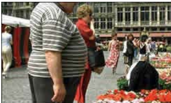
Obesidade masculina 176

A gordura corporal acumula-se de modos diversos em homens e mulheres. Nestas, localiza-se mais nos quadris. Naqueles, o depósito de gordura concentra-se no abdômen.