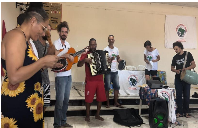
Fotografia 5 - Atingidos cantando em encontro.