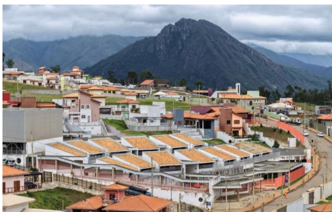
Fotografia 9 - Distritos de Novo Bento Rodrigues e Paracatu estão 100% prontos.

Entre os desdobramentos mais controversos do processo de reparação está o reassentamento dos atingidos de Bento Rodrigues. Mais de sete anos após o rompimento da barragem, apenas uma pequena parte das famílias havia recebido suas casas no novo vilarejo, construído a 11 quilômetros do local original. Embora a Fundação Renova afirme que o reassentamento está em fase avançada, denúncias de atrasos, problemas estruturais e descaracterização do modo de vida anterior são frequentes. A nova vila, com casas amplas, varandas e acabamentos sofisticados, tem sido chamada por alguns moradores e críticos de "Alphabento", em referência a condomínios de luxo como Alphaville (Monteiro, 2023). A configuração do novo reassentamento pode ser observada na imagem a seguir, que evidencia a padronização das moradias e a reconfiguração do território.