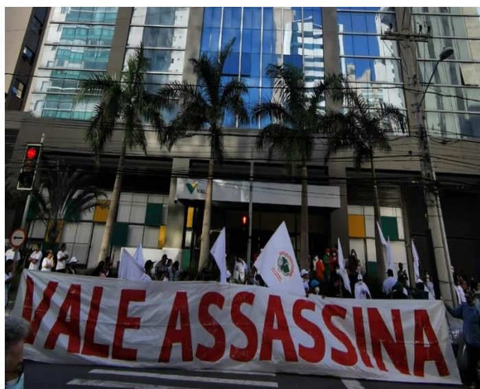
Fotografia 3 – Em ato contra a Vale, atingidos por barragens chamam mineradora de assassina.