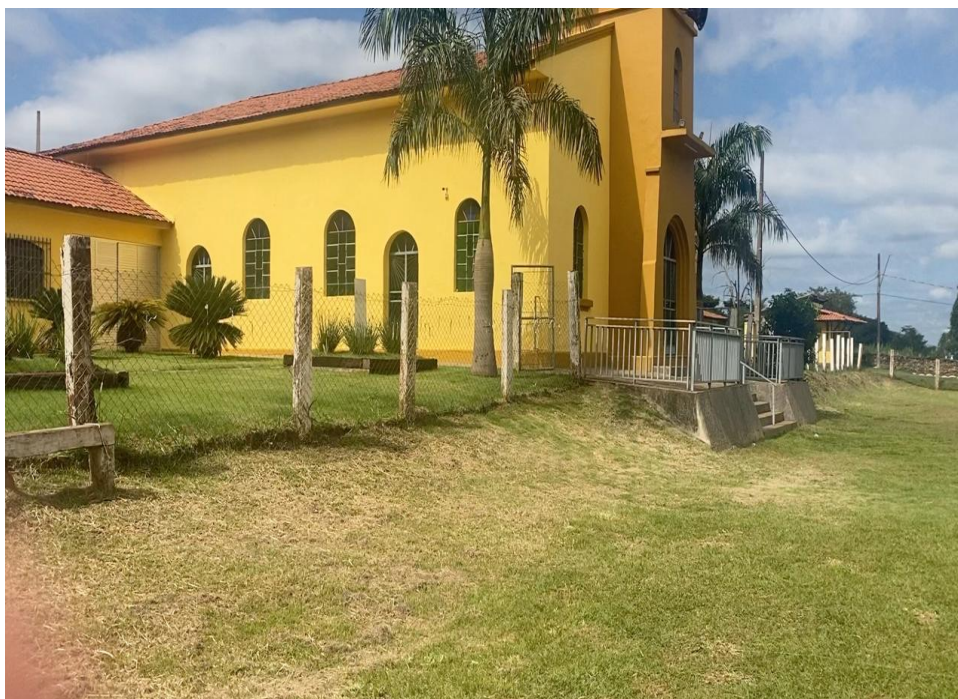
Fotografia 18 – Igreja Nossa Senhora das Dores, onde ficavam os corpos resgatados da lama.