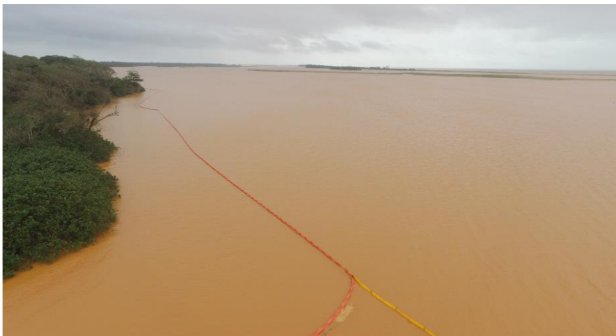
Fotografia 10 – Vista da Foz do Rio Doce, localizada em Regência, Linhares.

A imagem a seguir evidencia a instalação de boias de contenção ao longo do Rio Doce, uma das poucas medidas adotadas pelas empresas mineradoras na tentativa de impedir o avanço da lama. Ainda que apresentadas como estratégia de mitigação, tais estruturas mostraram-se manifestamente insuficientes diante da magnitude do desastre, incapazes de conter a extensão dos danos ambientais e sociais provocados.