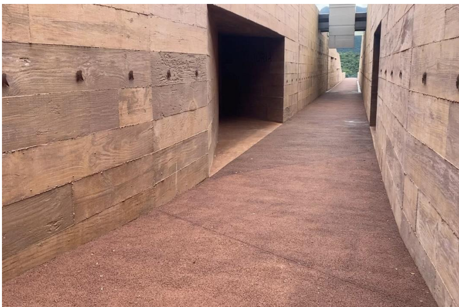
Fotografia 16 – Corredor interno do memorial.