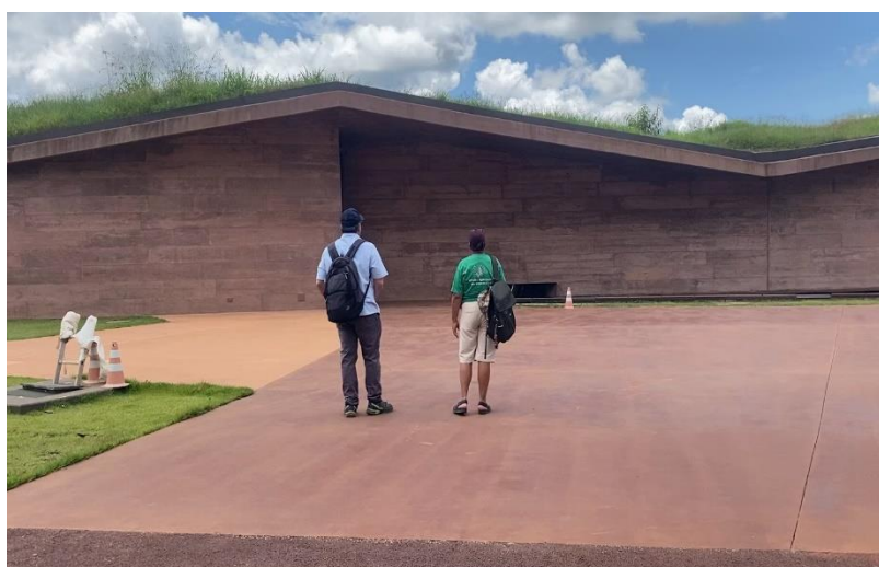
Fotografia 15 – Vista externa do memorial Brumadinho.