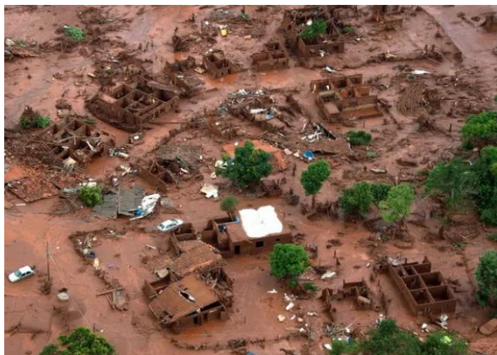
Fotografia 8 – Mariana, Minas Gerais: panorama da destruição após o rompimento da barragem de Fundão.