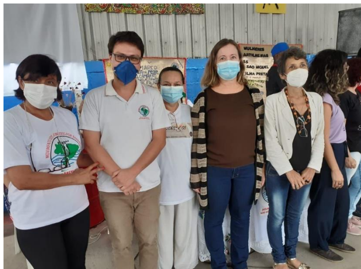
Fotografia 2 - Encontro de Aliados do MAB, em comemoração aos 30 anos do movimento, realizado no galpão do Pega no Samba, bairro Consolação, Vitória/ES.