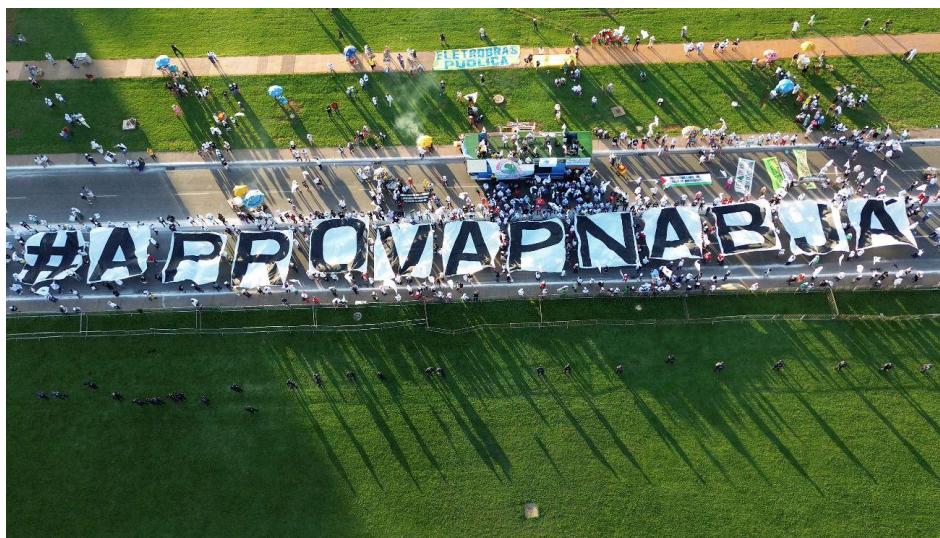
Fotografia 1 – Atingidos por barragens em mobilização após a aprovação da PNAB.

Fonte: Foto de Cleiton Santos/AEDAS. Disponibilizada por MAB (2026).