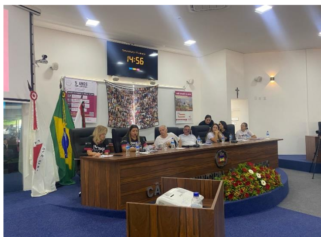
Fotografia 6 – Seminário 5 anos sem Justiça, na Câmara Municipal de Brumadinho.

Em janeiro de 2024, participei das atividades que marcaram os cinco anos do crime de Brumadinho, quando ouvi cerca de cinco pessoas – entre familiares de vítimas, moradores e representantes da AVABRUM. As homenagens, realizadas na Câmara Municipal e em outros espaços do município, alternavam momentos de dor, memória e denúncia: nomes lidos em voz alta como um cortejo de ausência, vozes que, apesar do cansaço, reiteravam a denúncia contra a impunidade, a lentidão da reparação e o silêncio institucional que persiste mesmo diante de um dos maiores crimes socioambientais do país. Nesses dias entrevistei e ouvi nove pessoas – entre familiares de vítimas, moradores e representantes da AVABRUM.