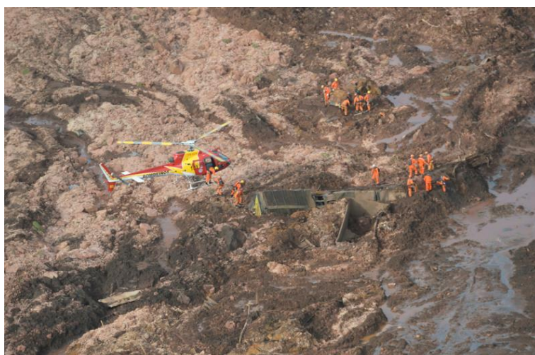
Fotografia 7 – Equipe realizando resgate dos corpos em Córrego do Feijão.

Dona Regina pediu-me que não publicasse fotos do espaço ainda inacabado – e assim o fiz, respeitando o caráter íntimo e coletivo daquele lugar. Foi ela quem me levou à Igreja Nossa Senhora das Dores, margeada por um campo de futebol, aonde chegavam os helicópteros da operação, templo religioso que abrigou a base de operações entre 25 de janeiro e 20 de fevereiro e onde foram depositados, nos primeiros meses, os corpos resgatados da lama, e me guiou até a área em que a Vale realiza hoje, a “remineração”, com caminhões circulando dia e noite, o som metálico das máquinas nunca cessando, um território em constante movimento forçado, onde a terra parece não ter mais descanso. A cidade inteira carrega uma poeira marrom, onipresente, que contrasta de modo quase cruel com o Parque Inhotim, vizinho e exuberante, um oásis verde de arte e preservação ambiental diante de um cenário de destruição e luto. A cena é ilustrada na imagem a seguir, que registra a atuação de helicópteros no resgate das vítimas no Córrego do Feijão, evidenciando a dimensão trágica e a complexidade das operações após o rompimento.