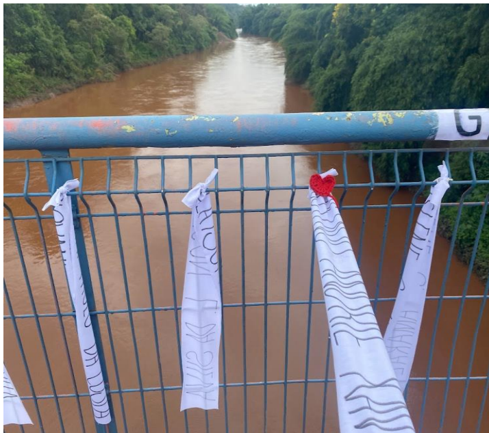
Fotografia 19 - Memorial sobre o rio Paraopeba com fitas em homenagem às 272 vítimas de Brumadinho.