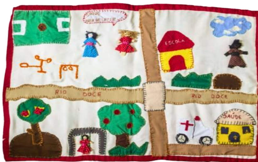
Fotografia 13 – Mulheres do Rio Doce em Luta por Direitos.

Fotografia de 2019.