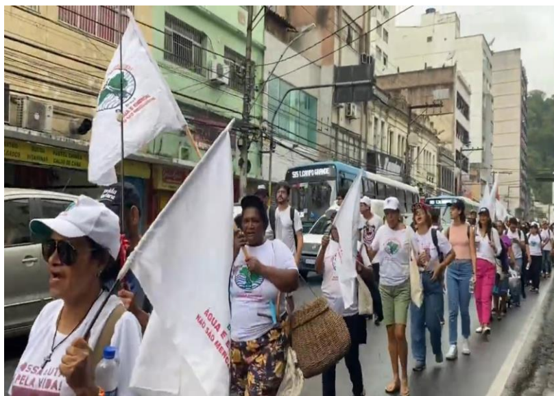
Fotografia 4 – Marcha dos atingidos no centro de Vitória em outubro de 2023.