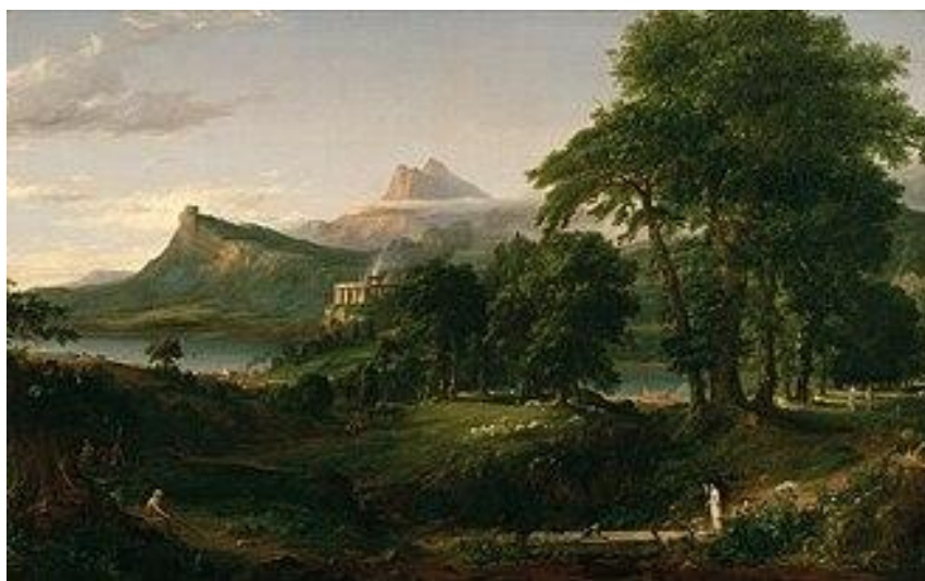
Figura 4 – “O estado arcádico ou pastoril”, de Thomas Cole

Fonte: Thomas Cole National Historic Site (Cole, 1834-1836).