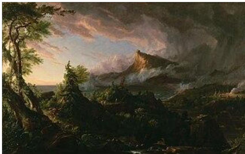
Figura 3 – “O estado selvagem”, de Thomas Cole