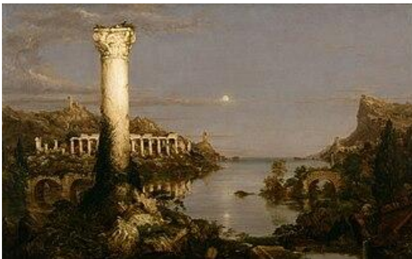
Figura 7 – “Desolação”, de Thomas Cole