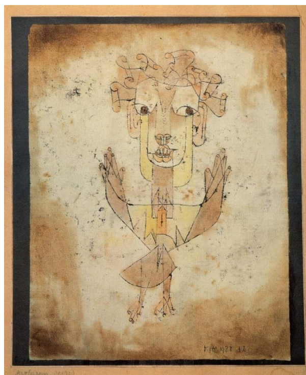
Figura 9 – “Angelus Novus”, de Paul Klee