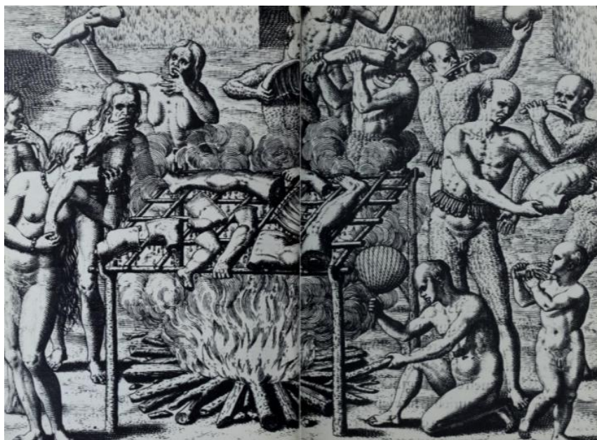
Figura 8 – Cenas de Antropofagia no Brasil, de Theodor de Bry