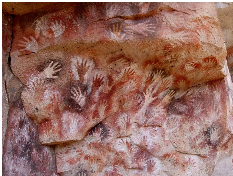
Figura 2 - “Cueva de las Manos, Río Pinturas”