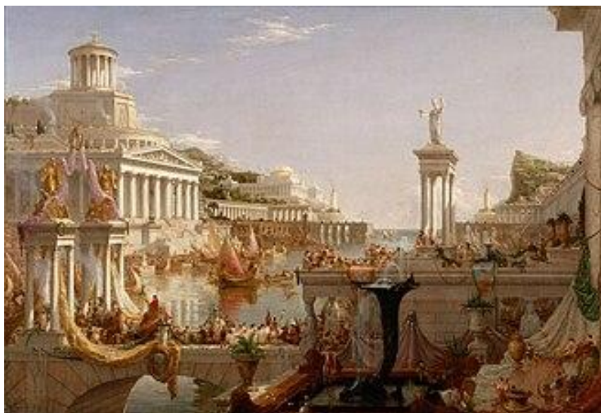
Figura 5 – “A consumação do império”, de Thomas Cole

Fonte: Thomas Cole National Historic Site (Cole, 1834-1836).