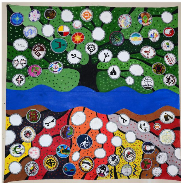
Figura 10 – “A Árvore de Todos os Saberes”, por Jaider Esbell