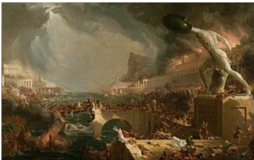
Figura 6 – “Destruição”, de Thomas Cole