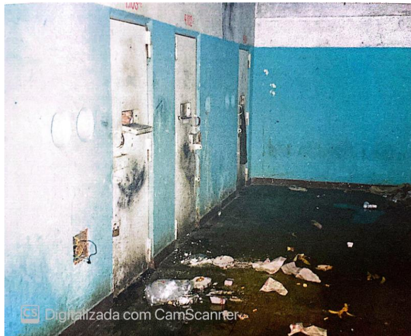
Fotografia 3. Refeições recusadas (VARELLA, 1999, imagem 11)

A comida servida pela Casa é triste. Depois de alguns dias, não há cristão que consiga digeri-la; a queixa é geral. Os que não têm ganha-pão na própria cadeia ou família para ajudar, sofrem. Riquíssima em amido e gordura, a dieta, entretanto, engorda. Obesidade aliada à falta de exercício físico é um dos problemas de saúde da Detenção. (VARELLA, 1999, p. 42).