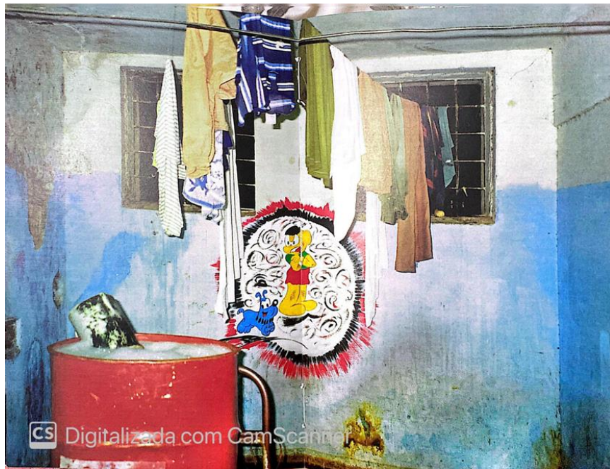
Fotografia 4. Infiltrações Carandiru (VARELLA, 1999)