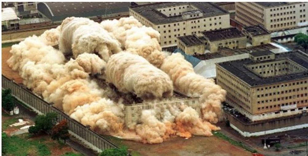
Fotografia 2. Implosão do Carandiru (ANGOTTI; BANDEIRA, 2020, on-line )

A implosão do Carandiru, também impulsionada pela pressão de organizações de direitos humanos, foi uma forma política de demonstrar uma intenção em reformar o sistema prisional e melhorar as condições carcerárias em todo o país. No entanto, como é evidenciado, poucos esforços foram direcionados à melhoria do sistema prisional brasileiro, ao passo que no Brasil inúmeros “Carandirus” ainda estão em funcionamento.