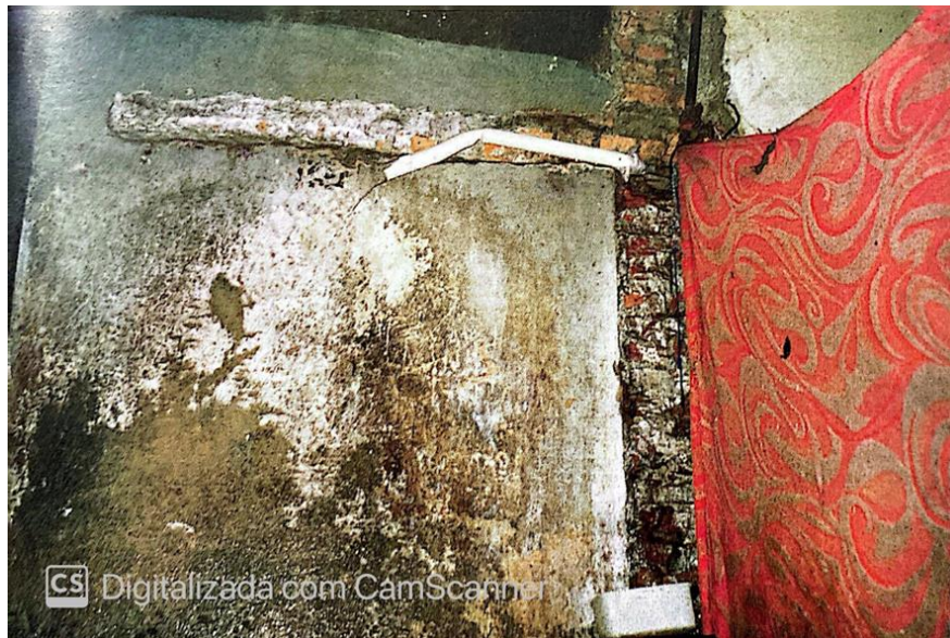
Fotografia 5. Chuveiro Carandiru (VARELLA, 1999, figura 8)

Nesse ponto, se faz necessário a reflexão de como esses dois aspectos influenciam na saúde emocional e física do indivíduo. Viver em um ambiente repleto de infiltrações, além de provocar problemas no trato respiratório, também podem causar dores de cabeça, confusão mental e déficit no desempenho cognitivo (ESTADO DE MINAS, 2023, on-line ). Da mesma forma, a má alimentação está, por óbvio, ligada à saúde humana, mas também está intrinsecamente relacionada ao psicológico daquele que