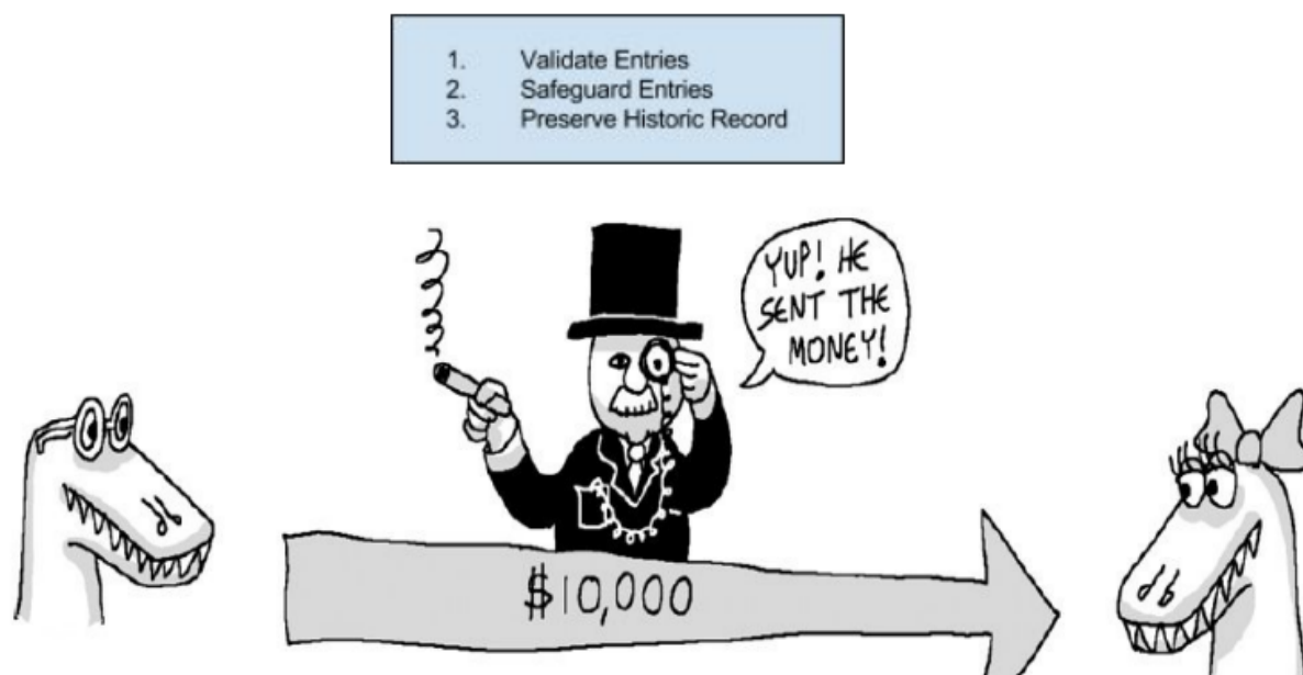
Figure 1. Traditional online financial transactions using third trusted party ( Banks, Paypal etc.) 1 .

Ilustração 1 - Charge que demonstra como ocorre uma transferência tradicional de dinheiro.